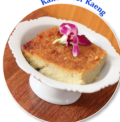
Kanom Mor Kaeng